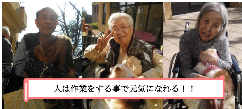
人は作業をする事で元気になれる！！

通所リハビリテーションでは、午前中に計算や漢字・音読等の頭の体操、各々作成したい物（編み物・ちぎり絵・ロールピクチャー等）を主に行っています。入所サービスでは曜日別に、①計算や漢字（頭の体操）、塗り絵等、②料理、③作品作り（季節に関する物）を行っています。また、昨年は入所の方を対象に2回アニマルセラピーを実施しました。可愛いワンちゃんが来てくれ、皆さん笑顔で過ごされていました。