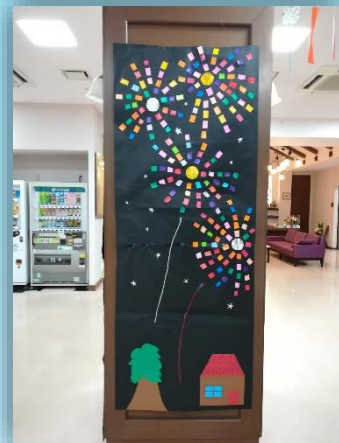
2F たんぽぽ・すずらん