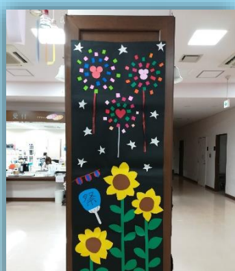
2F あさがお・ききょう