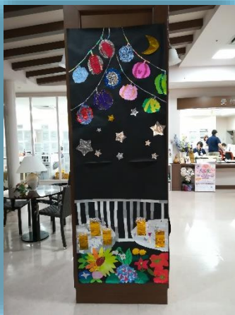
3F コスモス・りんどう