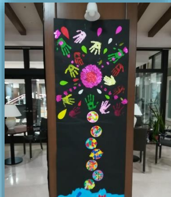
4F さくら・ひまわり

各ユニットにて『夏祭り』 『ビアガーデン』をテーマ に作成しました！ 皆様のお気に入りは、どの ユニットですか？ どのユニットも綺麗に仕上 がっていますね!(^^)!