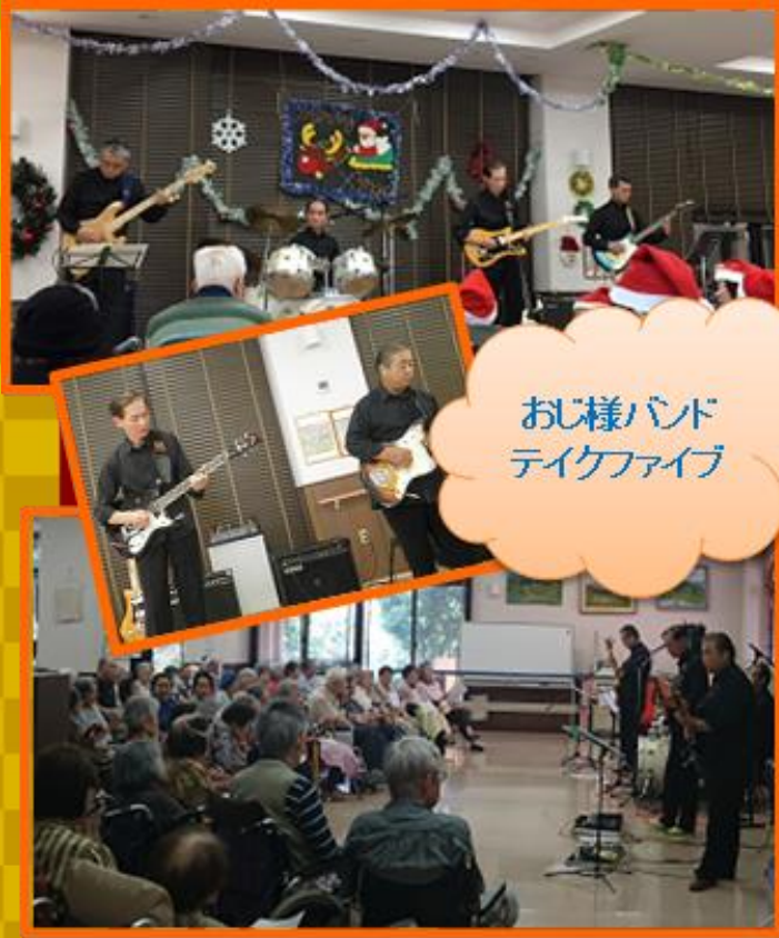
おじ様バンド テイクファイブ