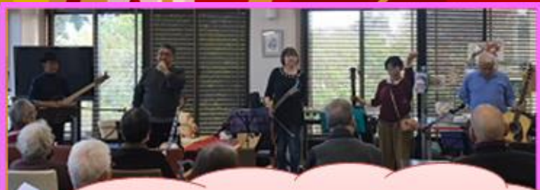
フォークソングの 久喜ヤンチャーズ♪