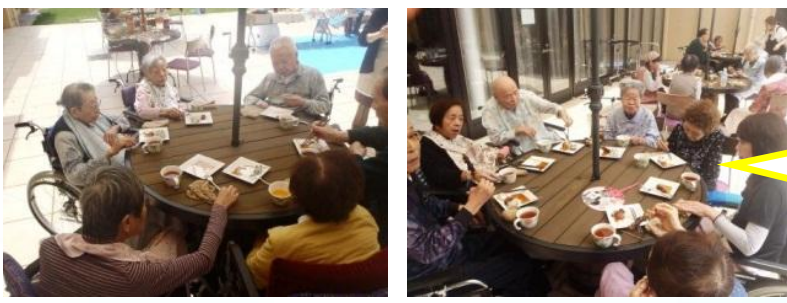
ゆうゆう中庭にて バーベキューをや りました