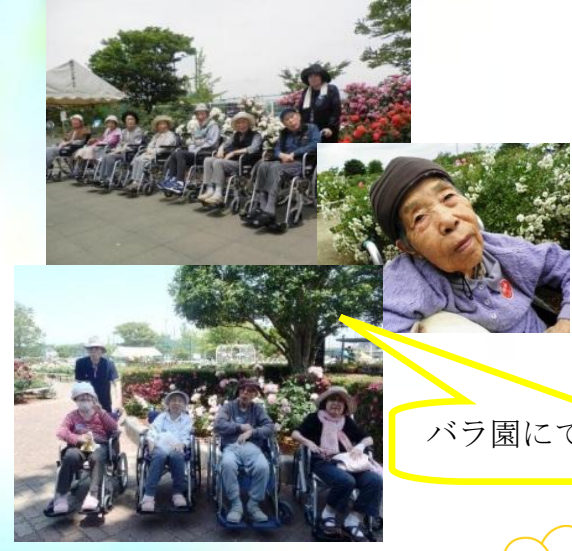
バラ園にて皆と記念写真