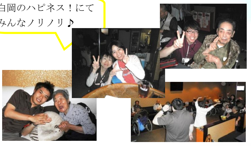
白岡のハピネス！にて みんなノリノリ♪