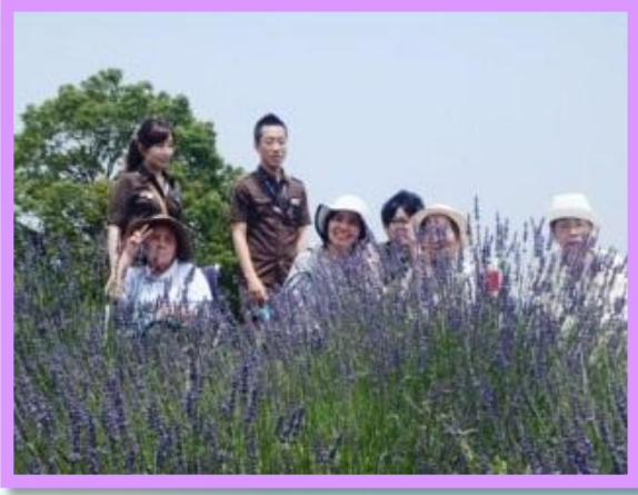
ラベンダーの香に癒され自然とみんな花にも負けない笑顔が溢れています。 お天気にも恵まれ気持ちの良いひとときとなりました♪