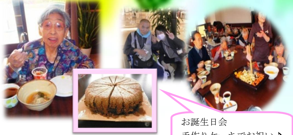
お誕生日会 手作りケーキでお祝い♪