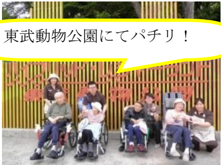
東武動物公園にてパチリ！