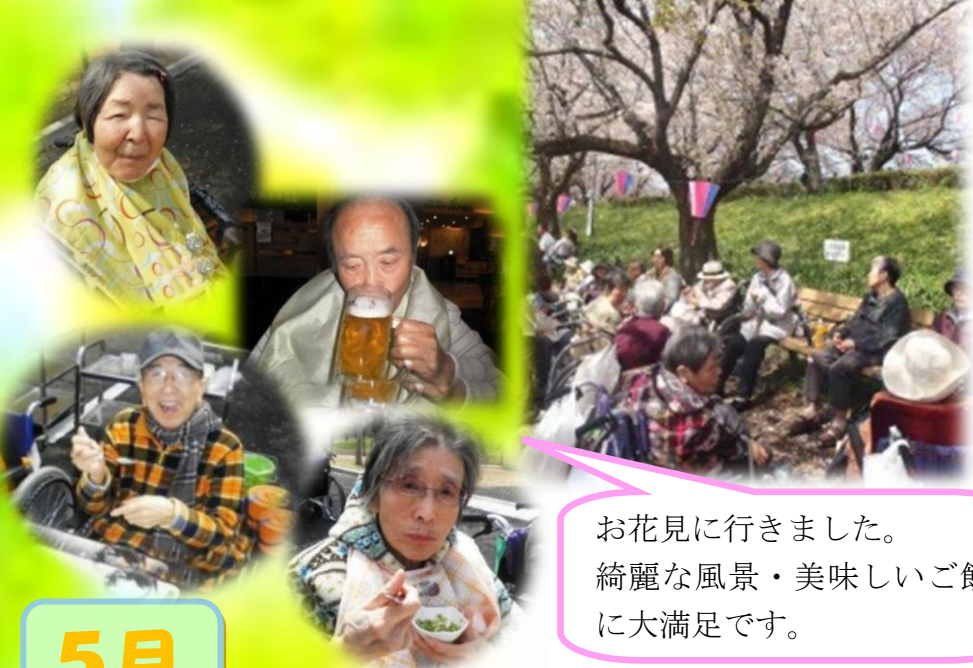
お花見に行きました。 綺麗な風景・美味しいご飯 に大満足です。